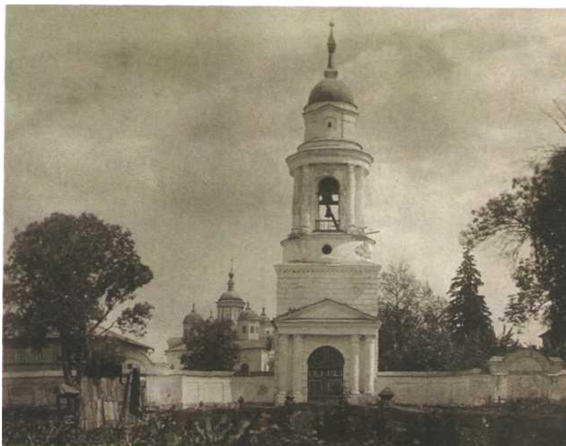
Колокольня Спасо-Челнского монастыря, вдали собор в честь Рождества Христова.

Большинство же каменных строений обители были возведены на рубеже XVII-XVIII веков, когда Трубчевский Спасо-Челнский монастырь принадлежал Севской Епархии.